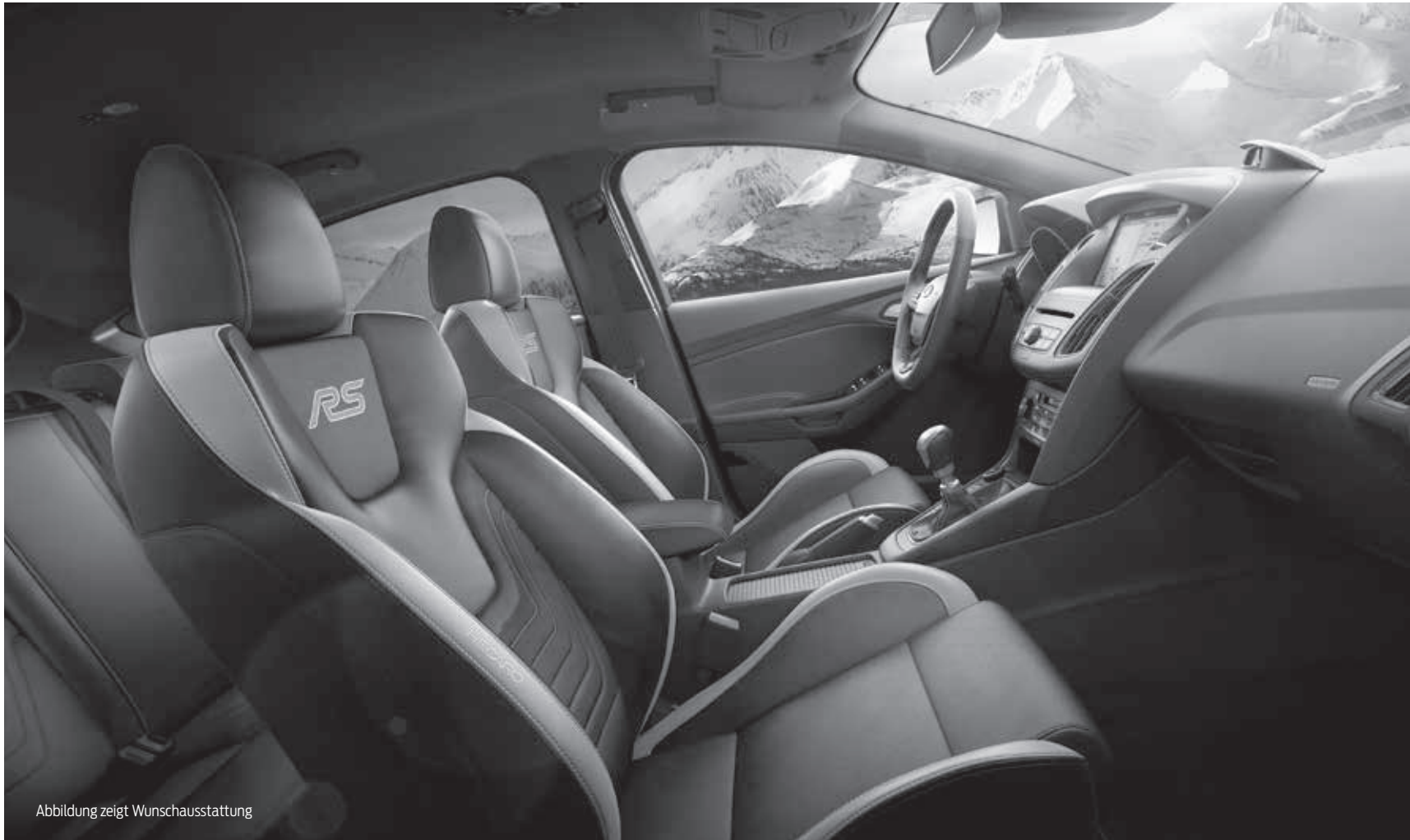
Abbildung zeigt Wunschausstattung