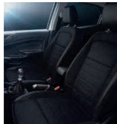
Leder-Stoff-Polsterung in Wildleder-Optik mit roten Ziernähten (Sitzwangen in Leder)