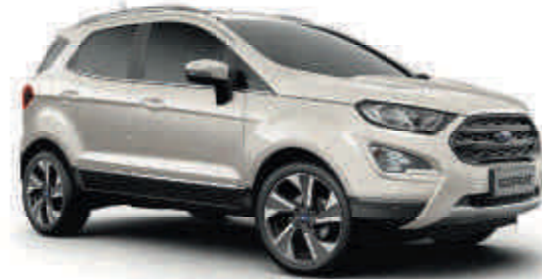
Arktis-Weiß spezielle Metallic-Lackierung*