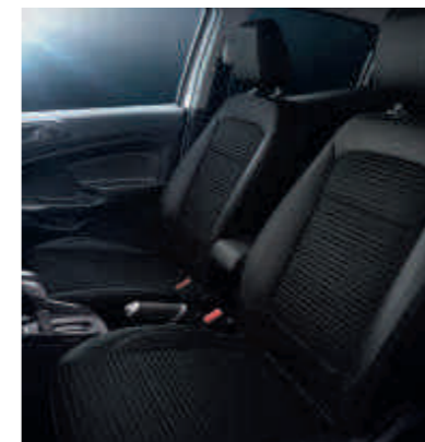
Leder-Stoff-Polsterung (Sitzwangen in Leder)