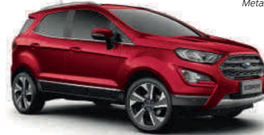
Ruby-Rot spezielle Metallic-Lackierung*