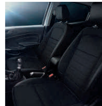
Leder-Stoff-Polsterung in Wildleder-Optik mit grauen Ziernähten (siehe Styling-Paket) (Sitzwangen in Leder)