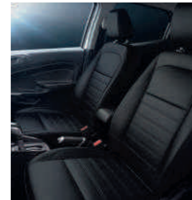
Lederpolsterung in Anthrazit (Sitzmittelbahnen und Sitzwangen in Leder)