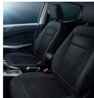
Stoffpolsterung in Anthrazit