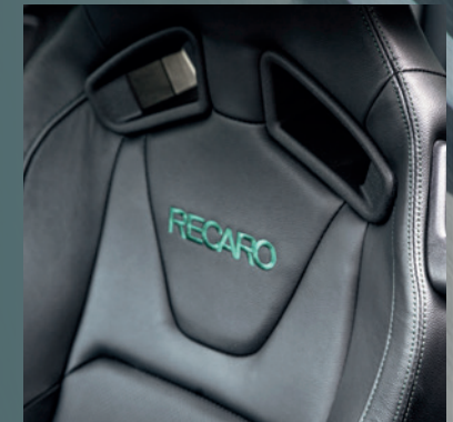
Recaro-Sportsitze vorn in Leder-Optik mit grünen Ziernähten (optional)