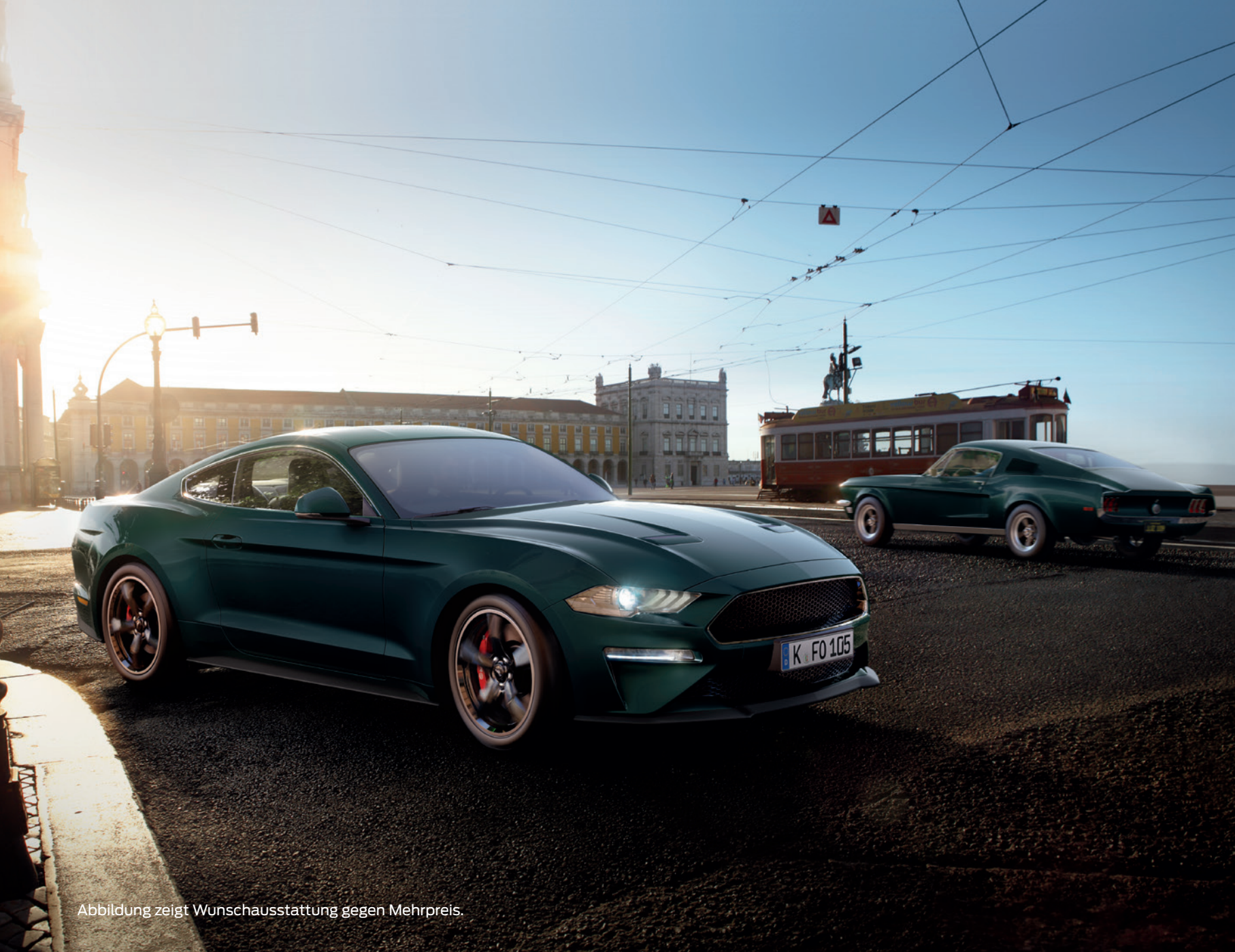
Abbildung zeigt Wunschausstattung gegen Mehrpreis.