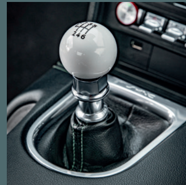
Schaltknauf im Bullitt TM -Design