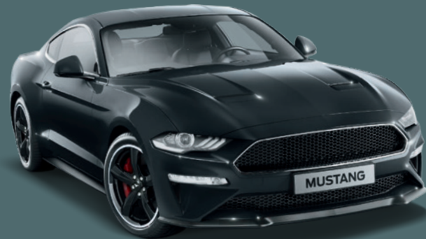
Iridium-Schwarz Mica 2