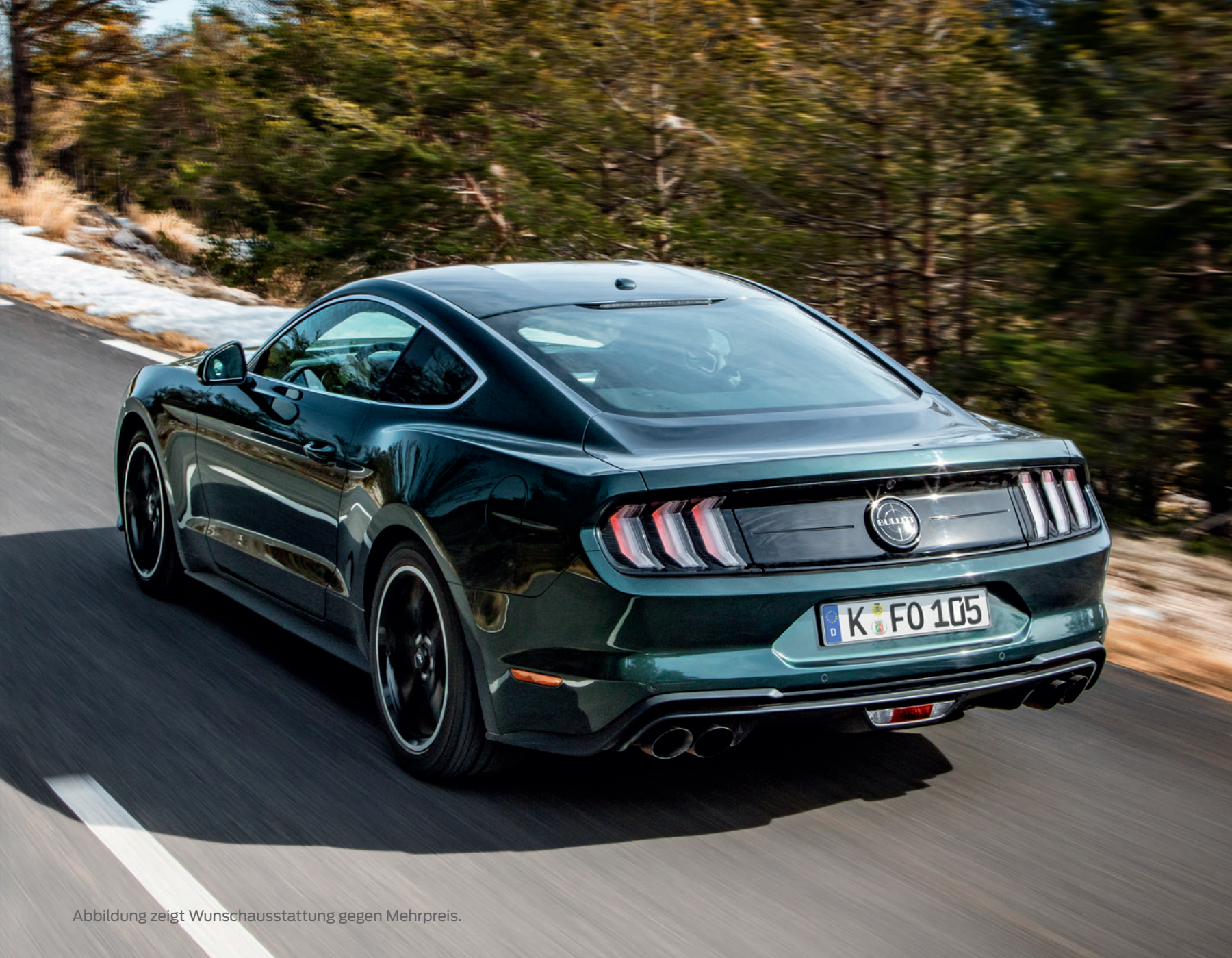
Abbildung zeigt Wunschausstattung gegen Mehrpreis.