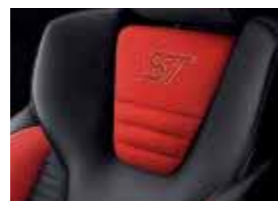
Leder-Stoff-Polsterung: Leder in Anthrazit und Stoff in Race-Rot*