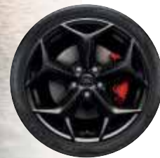
18"-Leichtmetall- räder in Schwarz*