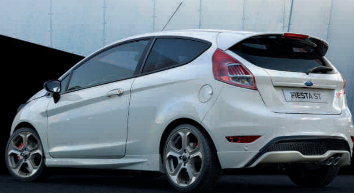
Abbildung zeigt einen Ford Fiesta ST in Frost-Weiß und einen Ford Focus ST in Sunset-Gelb Metallic

Erleben Sie herausragende Leistung und die vom Motorsport inspirierten Fahreigenschaften beim Ford Fiesta ST und Ford Focus ST. Das 6-Gang-Schaltgetriebe und die ST-optimierte Fahrdynamikregelung Torque Vectoring Control sorgen selbst in den anspruchsvollsten Situationen für hervorragenden Grip und präzises Handling.