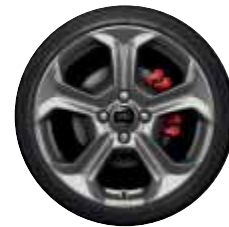
17"-Leichtmetall- räder in Rock Metallic*