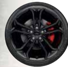
19"-Leichtmetall- räder in Schwarz*