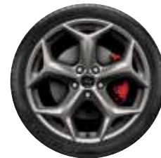
18"-Leichtmetall- räder in Rock- Metallic*