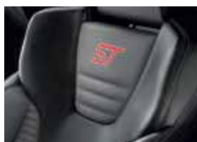
Leder-Stoff-Polsterung: Leder in Anthrazit und Stoff in Grau*