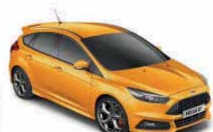
Sunset-Gelb spezielle ST-Metallic-Lackierung*