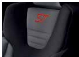
Stoff-Polsterung: Stoff in Anthrazit-Grün