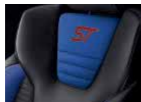
Leder-Stoff-Polsterung: Leder in Anthrazit und Stoff in Performance-Blau*