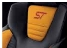
Leder-Stoff-Polsterung: Leder in Anthrazit und Stoff in Sunset-Gelb*