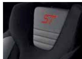
Stoff-Polsterung: Stoff in Anthrazit/Grau-Blau