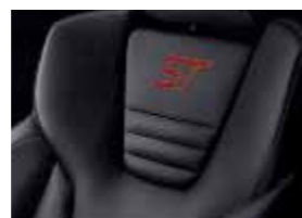
Leder-Polsterung: Windsor-Leder in Anthrazit*