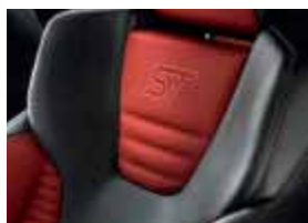
Leder-Stoff-Polsterung: Leder in Anthrazit und Stoff in Lava-Rot*