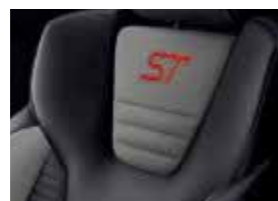
Leder-Stoff-Polsterung: Leder in Anthrazit und Stoff in Grau*