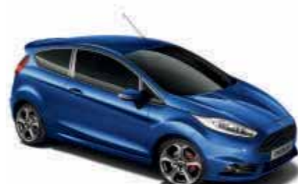
Performance-Blau spezielle ST-Metallic-Lackierung*