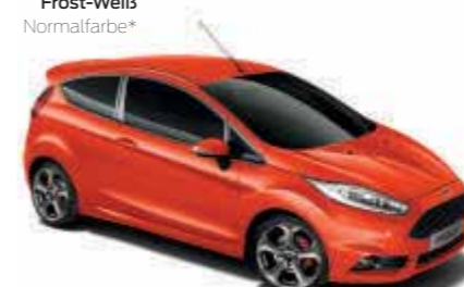
Lava-Rot spezielle ST-Metallic-Lackierung*