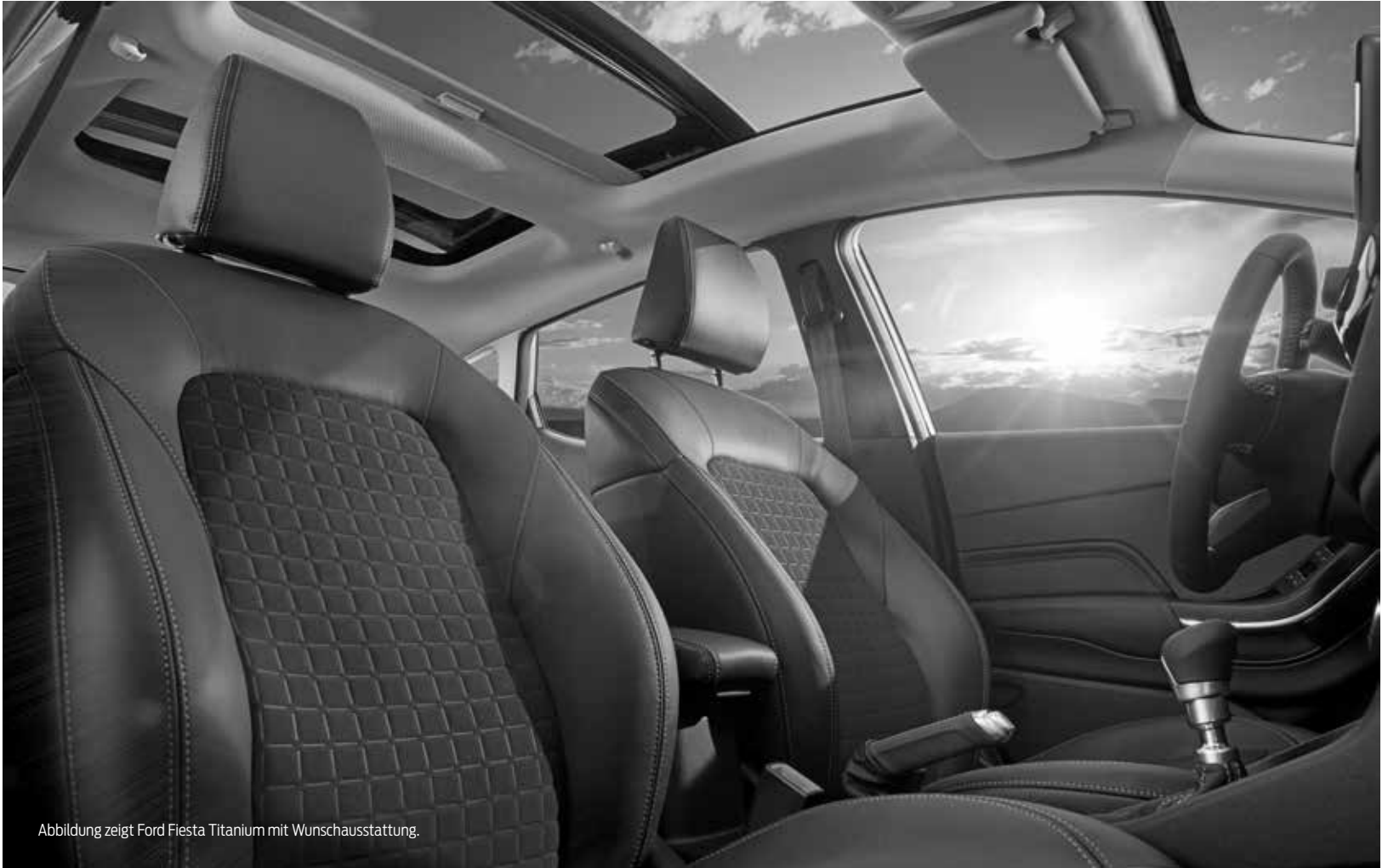
Abbildung zeigt Ford Fiesta Titanium mit Wunschausstattung.