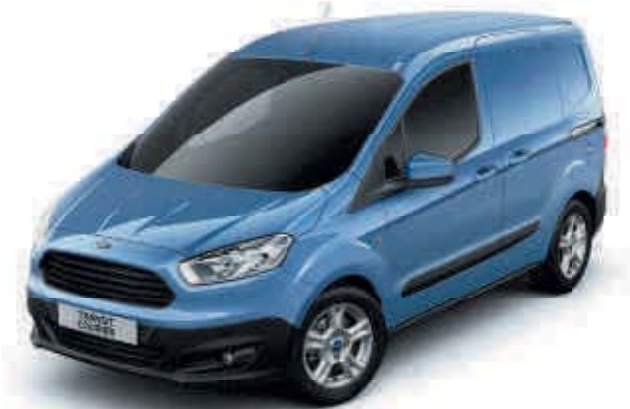
Skyline-Blau Metallic-Lackierung* (Nur erhältlich beim Trend)

*Metallic- und Mica-Lackierungen sind als Wunschausstattung gegen Aufpreis erhältlich. Hinweis Die Abbildungen dienen ausschließlich der Darstellung der Außenfarben und können deshalb von den aktuellen Fahrzeugspezifikationen abweichen. Die abgebildeten Außen- und Polsterfarben in dieser Broschüre können aus drucktechnischen Gründen geringfügig von den tatsächlichen Farben abweichen.