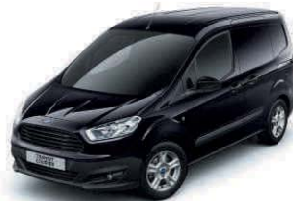
Iridium-Schwarz Metallic-Lackierung* [Mica]