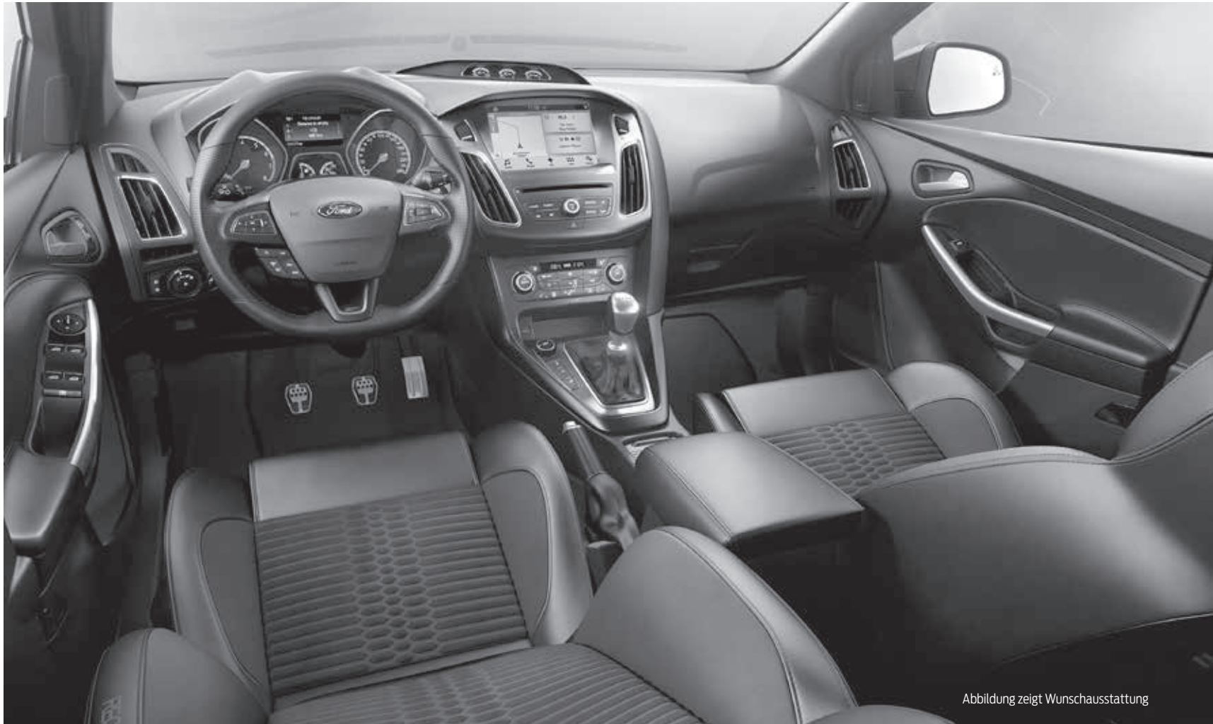
Abbildung zeigt Wunschausstattung